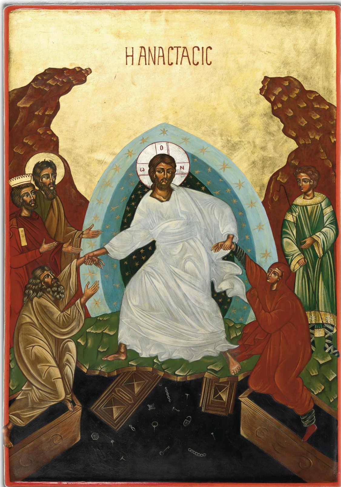
Ikone aus der Hand von Altabt Otto Strohmaier, Benediktinerabtei St. Lambrecht 2009