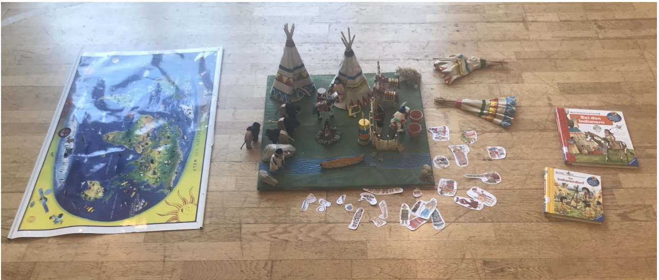
Bericht und Fotos: Nina Gillich